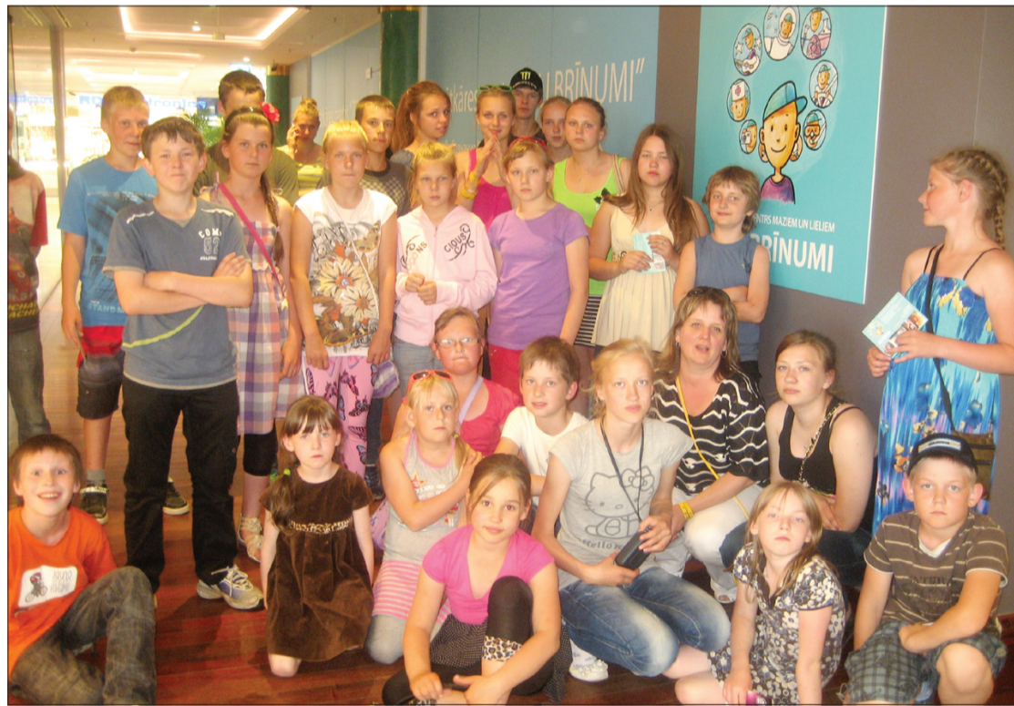
Par sasniegumiem mācībās skolēni devās izzinošā ekskursijā.

Skolēna galvenais pienākums ir mācīties, tāpēc Krotas Kronvalda Ata pamatskolā skolotāji rūpīgi izstrādā skolēnu motivācijas programmu. Viens no programmas virzieniem ir uzslavas raksti par labākajiem sasniegumiem mācību darbā ik mēnesi. Skolēniem bija iespēja saņemt klasē par 1.vietu – 5 punktu, par 2.vietu – 3 punktus, par 3.vietu – 1 punktu. Interesanti, ka klases līderi mainījās. Punktu varēja nopelnīt arī par dalību dažādās olimpiādēs un konkursos. Rezumējot parādīto, secinājām, ka 30 skolēnu