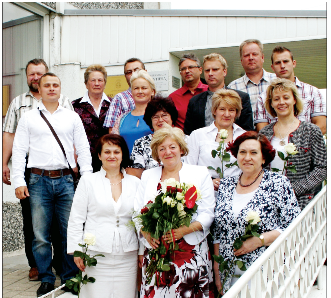
Priekules Novada domes jaunievēlētie deputāti.

14. jūnijā pirmajā Priekules Novada domes jaunā sasaukuma sēdē tika ievēlēta jaunā domes vadība un komitejas.