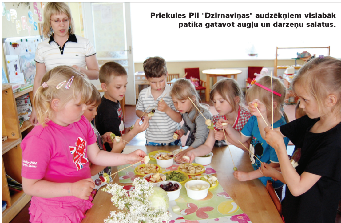
Priekules PII "Dzirnaviņas" audzēkņiem vislabāk patika gatavot augļu un dārzeņu salātus.

Lai cik paradoksāli tas izklausītos mūsdienai cilvēkam, kas lielākoties pārvietojas no sava dzīvokļa līdz auto un tad no auto līdz darbavietai un vairākas stundas darba un/vai atpūtas vajadzībām pavada pie datora, pašsaprotami, ka arī bērniem un skolēniem, kuri seko vecāku piemēram, šad tad nākas atgādināt par to, kā tas ir – dzīvot veselīgi un vai vispār tas iespējams.